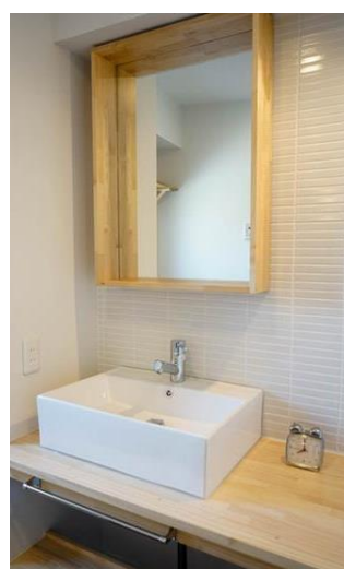
<リノベーション後のイメージ>