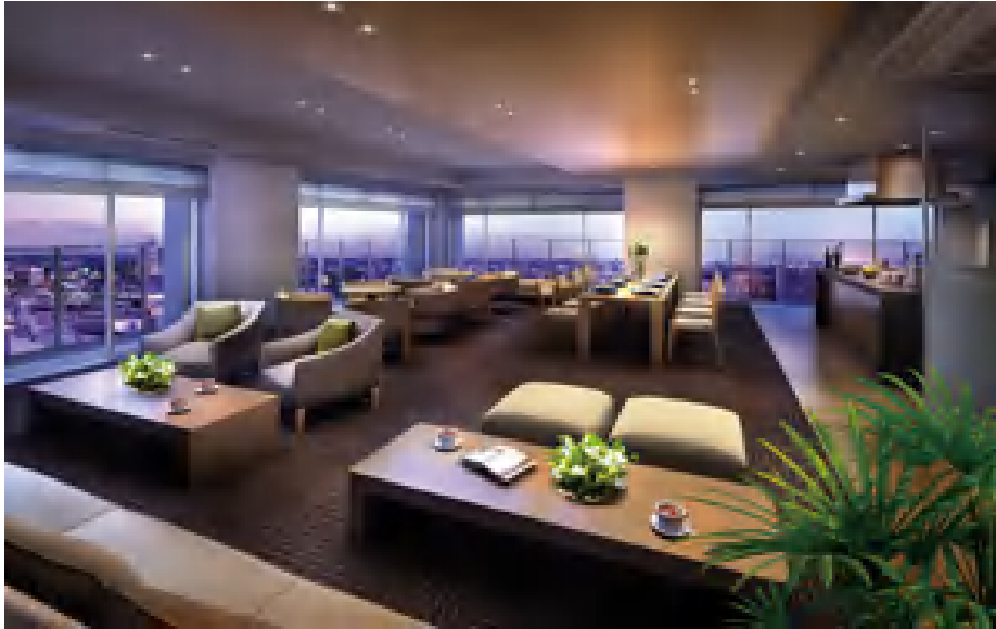
大規模マンションならではの充実した共用施設