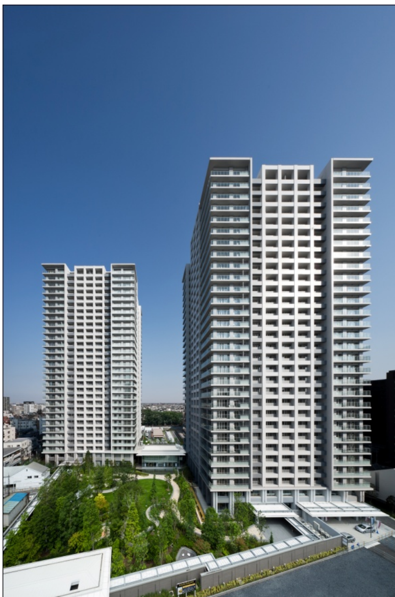
フォレストタワー