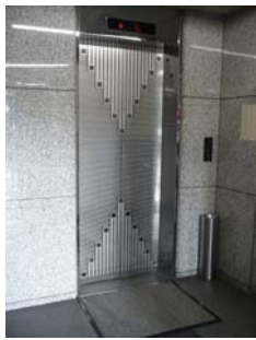
エレベーター ホール