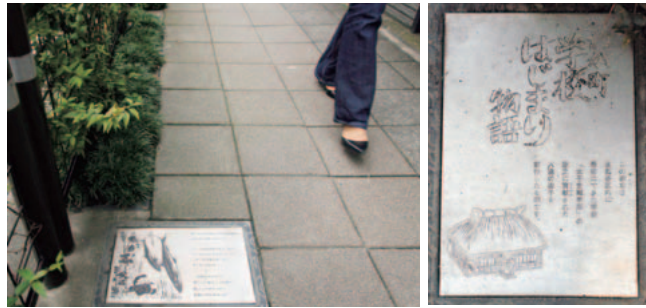
2~20m間隔で歩道に埋め込まれた絵本プレート。次の展開が気になって、つい急ぎ足に……。