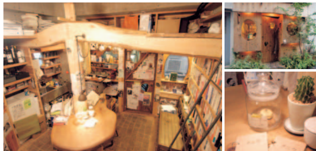
静かな店内に並んだ蔵書は約1000冊。飲み物とともにゆっくりと時間をすごすのはいかが？