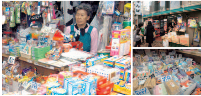
あれこれ目移りしてしまう店内。空気まで、昭和の香りがします。