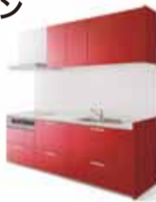
Panasonic リビングステーションV-style