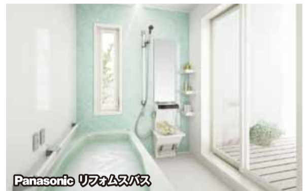
Panasonic リフォームスバス