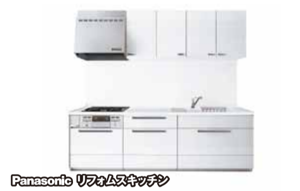
Panasonic リフォームキッチン