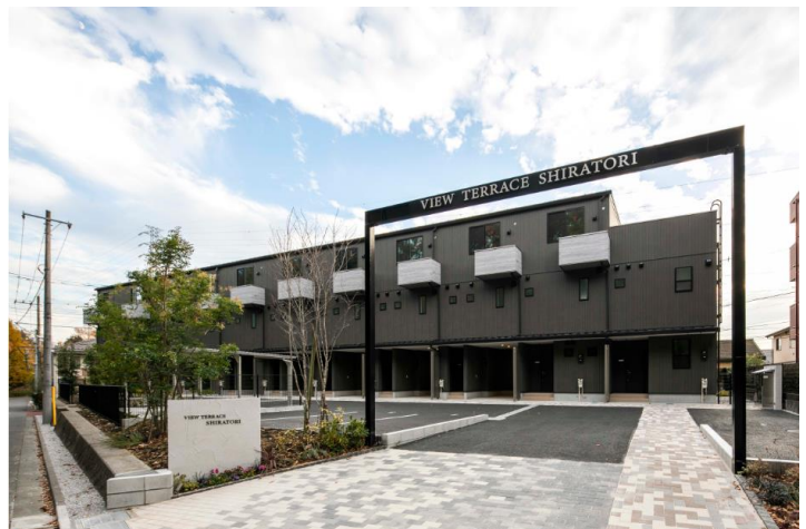
エントランス部分（北側）

また、本物件のような木造賃貸レジデンスについても、小田急沿線に居住する資産家などを中心に投資需要が見込まれることから、今後も継続的に事業化を推進してまいります。