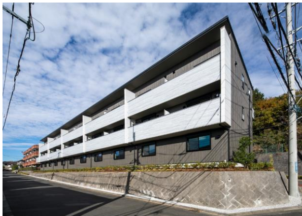
外観は木調をベースに硬質感のあるRC調のサイディングとし、ナチュラルでモダンな印象深いデザインに