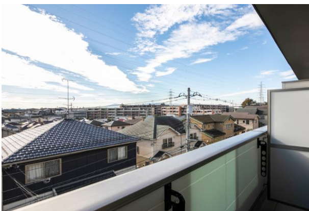
天気の良い日は、3階から富士山や大山を臨むことができ、眺めのある暮らしを享受できる