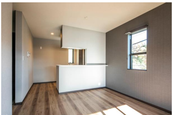
室内カラーパターン① シックで格調高い「ヴィンテージモダン」