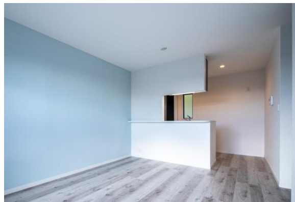
室内カラーパターン② 明るくナチュラルな「北欧モダン」