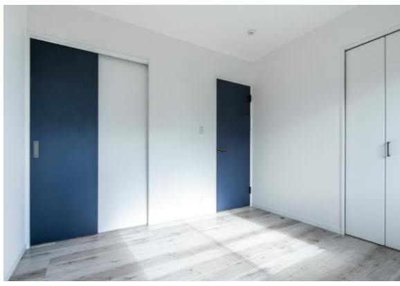
豊富な収納とおしゃれな建具は、暮らしを豊かに ※写真：北欧モダン（ネイビーブルー）