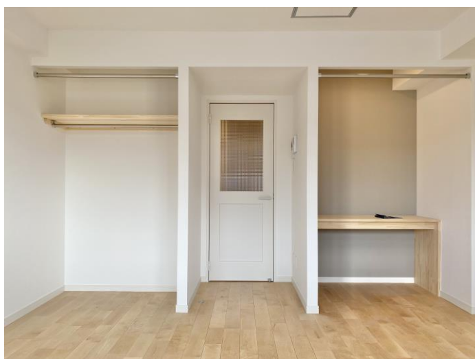
居室内写真（部分リノベーション住戸）