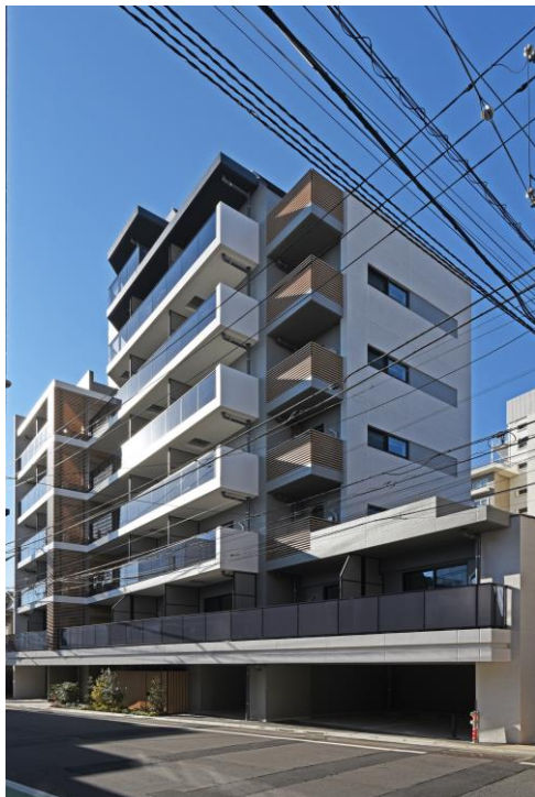
< 外 観 >

当社では、2029年度までに「賃貸業における資産規模1,000億円」を目指し、更なる事業拡大に向け精力的に取り組んでおり、今後も小田急沿線、東京都心部等を中心に、積極的に優良賃貸資産への投資を行ってまいります。