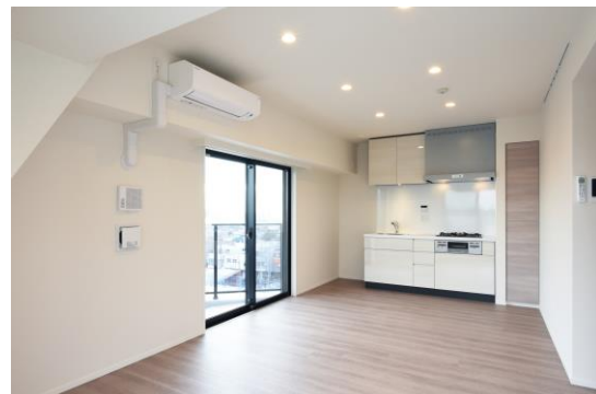
< 上：エントランスホール 下：専有部 >