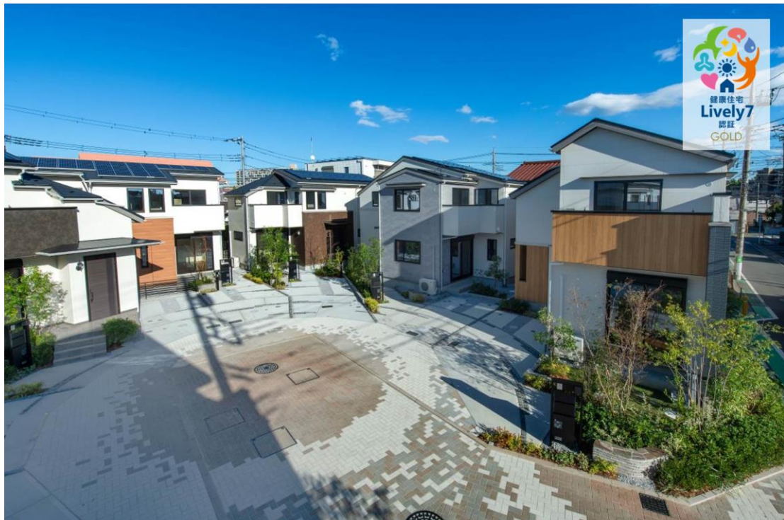
リーフィア 蒼翠の街 外観（昼景）

これらの工夫は本認証が定める、心身の望ましい状態に影響を及ぼす7つの領域のうち、特に「運動」「生体恒常性・代謝」領域で高く評価されたことに加え、「心の健康」に貢献する項目でも評価を得られました。