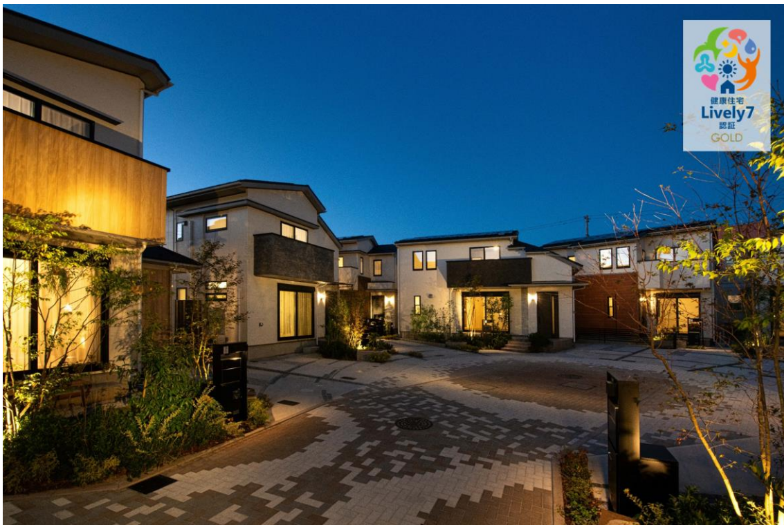
リーフィア狛江 蒼翠の街 街区中央のクルドサック（夜景）