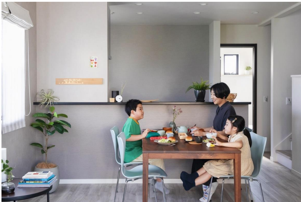
分譲戸建住宅への「mui ボード」設置イメージ

両社の提携を通じて、2025年初夏より小田急不動産の分譲戸建住宅「LEAFIA」（リーフィア）に、mui Lab が提供する「mui ボード」とスマートフォン専用アプリ「mui Kurashi アプリ」が搭載されます。また今後、「穏やかで温かい家族の時間を育むこと」を目的とした、mui ボードの新機能を二社共同で開発し、LEAFIA にお住まいのお客さまに先行リリースいたします。