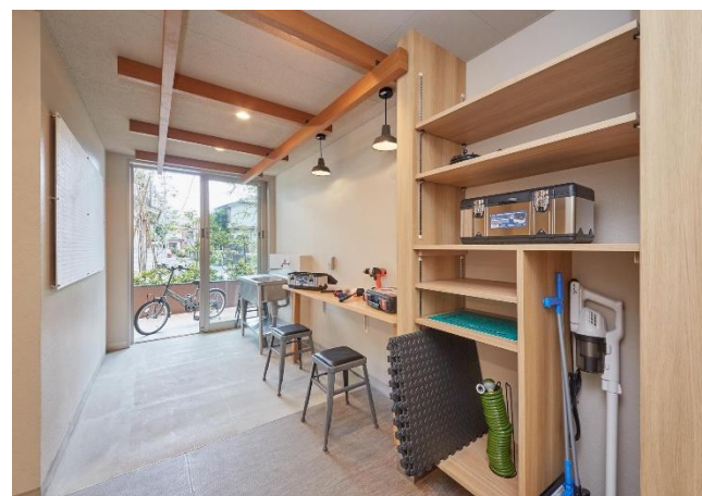
リーフィアレジデンス古淵 「みんなのDIY工房」写真