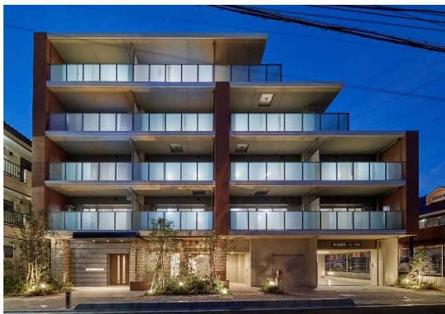
リーフィアレジデンス古淵 外観写真

https://www.odakyu-leafia.jp/mansion/sagamihara-kobuchi34/