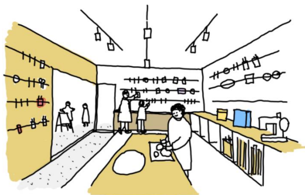
企画設計：i h r m k 一級建築士事務所