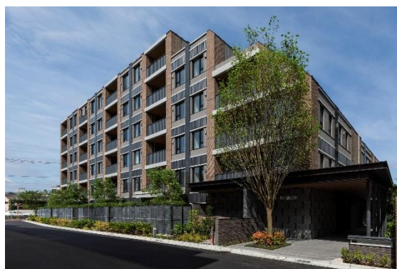
<リーフィアレジデンス調布小島町>