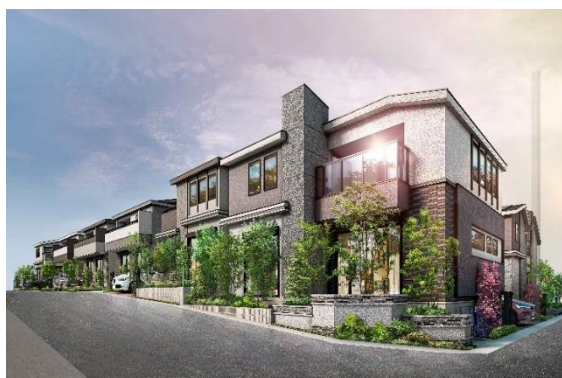
<リーフィア新百合ヶ丘グレイスコート>

【リーフィアブランドサイト】 https://www.odakyu-leafia.jp/brand/