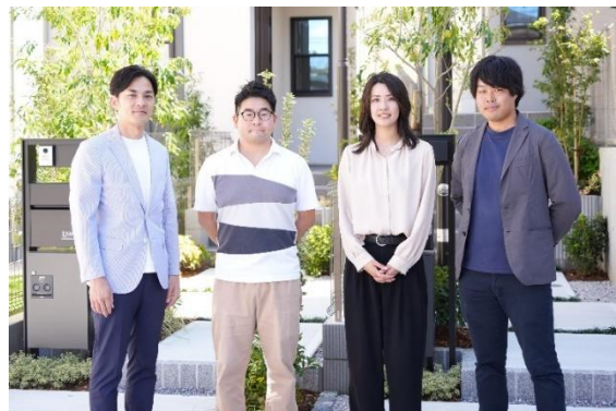
<開発者紹介（左より）>

「Life Jump」のアイデアによって、感情に素直で新たな広がりを見せる生活空間となることを期待しております。