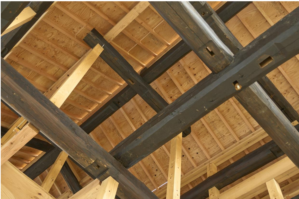
本モデルハウスの古材の大梁

当社では、古民家の「古材」を、新築住宅として循環利用する取組みを進めることで、サステナブル経営の一環として位置づけてまいります。