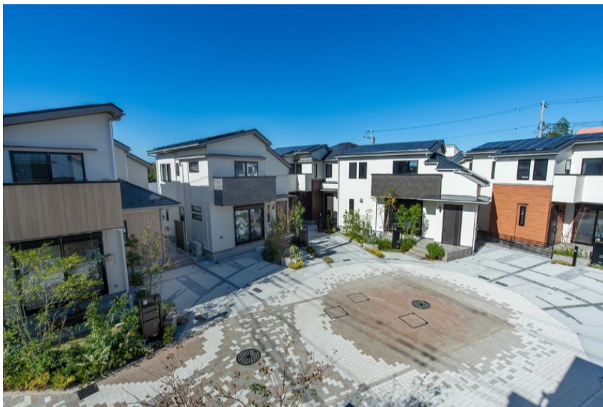
「リーフィア狛江 蒼翠の街」 (分譲済み一戸建て)