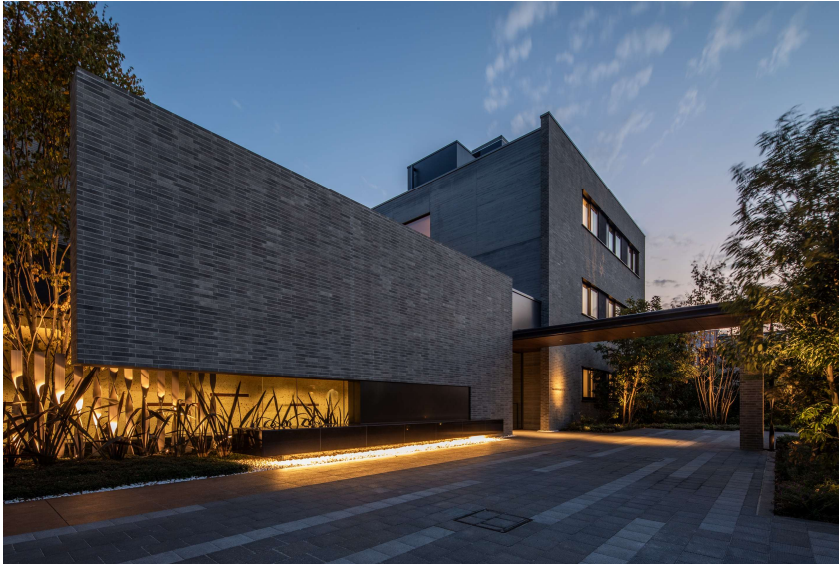
「ザ・リーフィアレジデンス成城」 (分譲済みマンション)

代表実績として、2018年度グッドデザイン賞を受賞した「ザ・リーフィアレジデンス成城」や2024年度キッズデザイン協議会会長賞を受賞した「リーフィア狛江 蒼翠の街」が挙げられます。