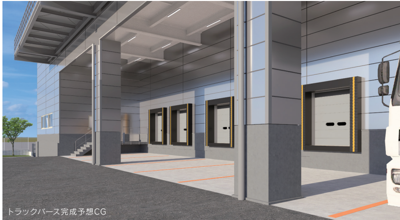
トラックバス完成予想CG