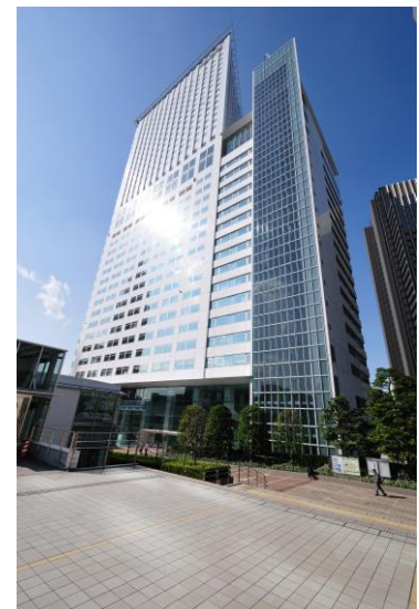
セミナー会場（小田急サザンタワー）

小田急グループでは、このような取り組みを通じて、沿線の皆さまとのコミュニケーションをこれまで以上に強化するとともに、引き続き「相続」「空家」に関するお客さまの問題解決に積極的に対応してまいります。