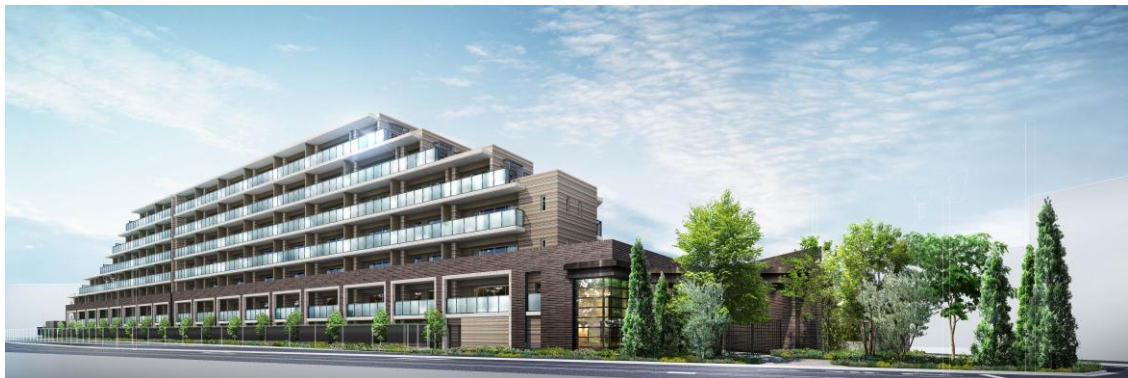
プレイスガーデン喜多見 (外観・イメージ)