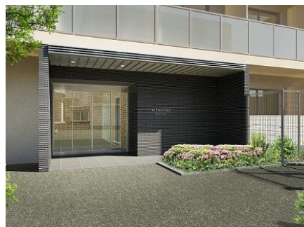
リージア経堂イーストプレイス (外観・イメージ)