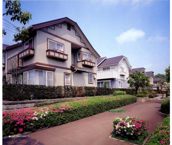
(町田やくし台分譲時)