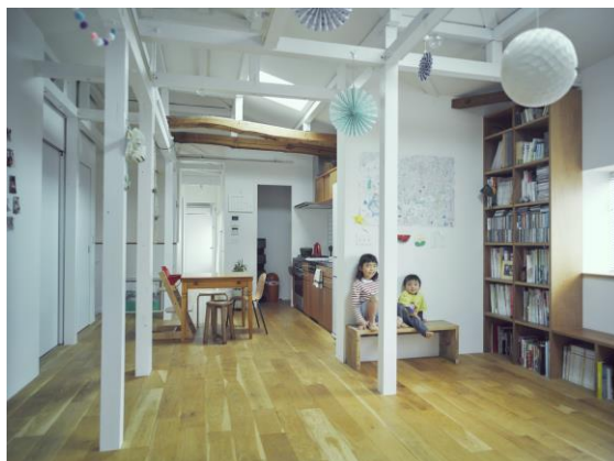
（リノベーションイメージ）

本セミナーをきっかけとして、「親世帯の予防介護」「親世帯の子育て参画」「地域への若年層の流入」を促進し、永く魅力的な住宅団地を形成することで、空き家問題をはじめとする郊外戸建て団地の抱える社会的課題の解消を目指してまいります。