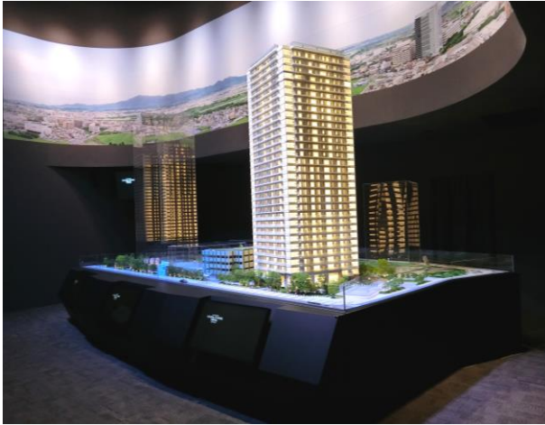
大型模型を展示した模型室

マンションギャラリーでは、本物件のスケールを大型模型等で視覚的に分かり易く表現しています。また、開発に込める想いや海老名の魅力、タワーレジデンスでのライフスタイル等は横幅7mの大画面シアターにて効果的に演出しています。