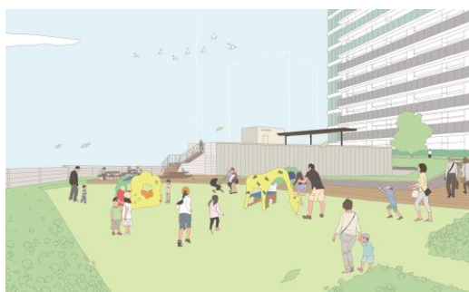
エアリーガーデン（駐車場棟屋上緑化）イメージ