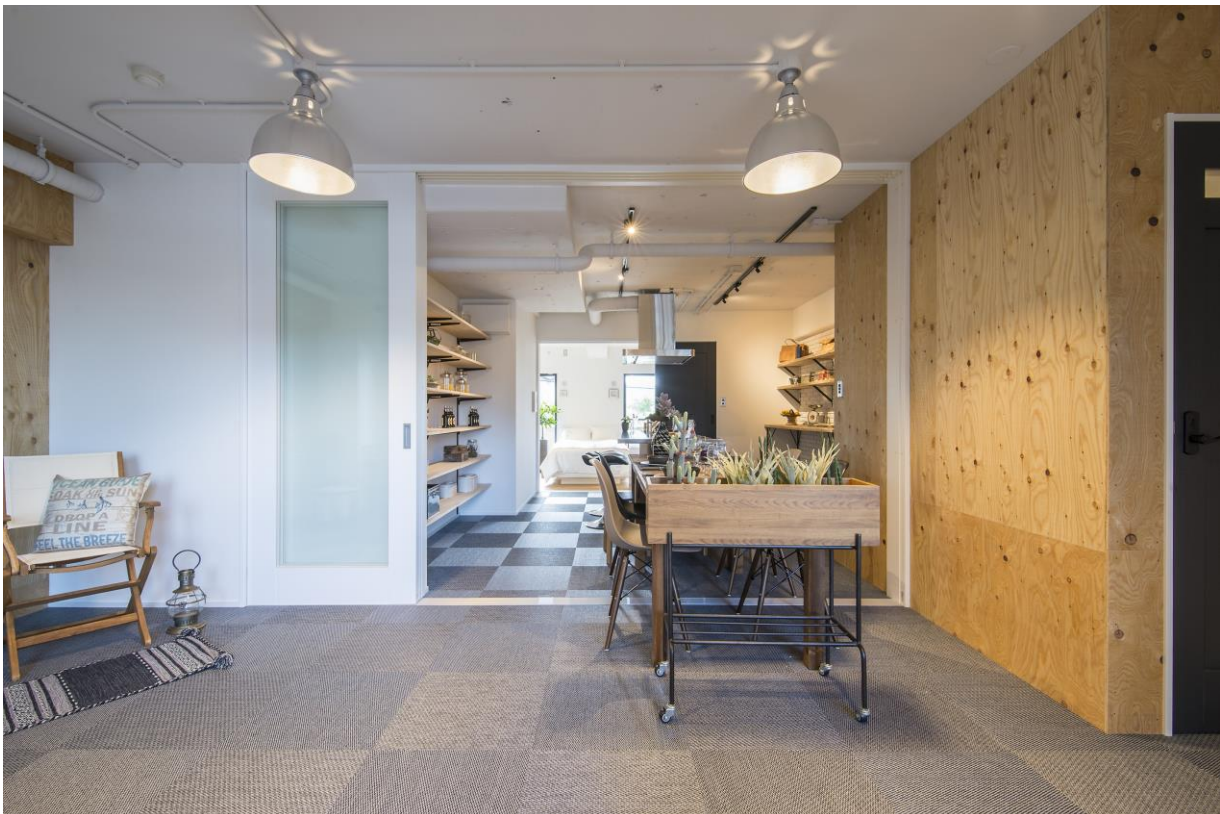
「あそぶ」をコンセプトにしたモデルルーム

株式会社小田急ハウジング（本社：東京都渋谷区 社長：菅原 康洋）および小田急不動産株式会社（本社：東京都渋谷区 社長：雪竹 正英）では、マンションリノベーションの提案強化策として、新商品「リノフィーノ」を12月1日（金）より発売し、第一弾として「あそぶ」をコンセプトにしたモデルルームを開設しましたので、お知らせいたします。