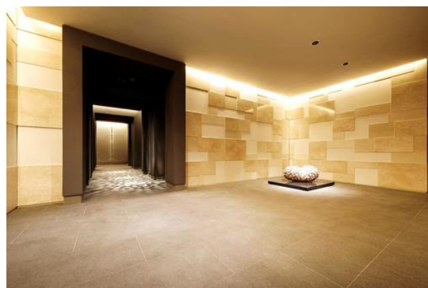
<エントランスホール>

また、本物件周辺に存する豊かな緑を想起する「THE GALLERY in the WOODS」を全体コンセプトとし、共用部の各所にアート作品を配置しました。