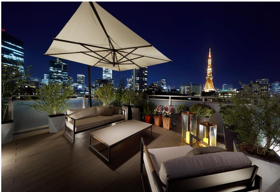
<ルーフバルコニーからの眺望>

本物件は小田急不動産が保有していた築15年の賃貸マンションで、大規模修繕工事と併せて専有部および共用部を改修、刷新しました。リノベーションにあたり、「都会の喧騒から離れた高級レジデンスに相応しい落ち着いた感のある立地」を最大限に活かし、都心の富裕層をターゲットにデザイン性やグレード感を追求し、付加価値の最大化を図りました。