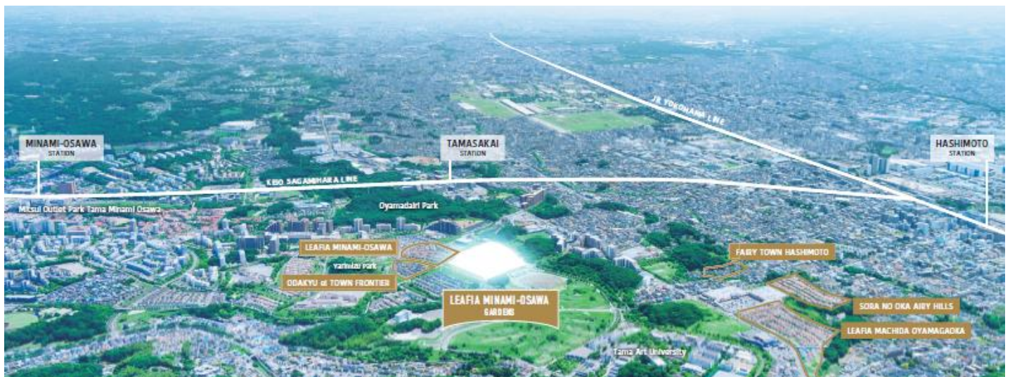
<京王線「南大沢」駅～「橋本」駅間エリア航空写真>

また、本物件の更なる認知拡大を目指して、イメージキャラクターを採用し、街開きイベントを4月27日（土）から4月30日（火）の4日間にて開催します。