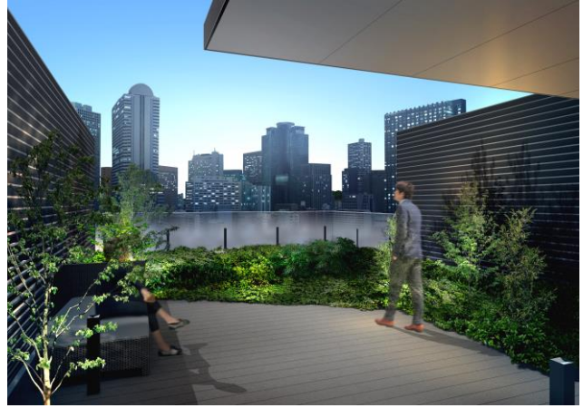
左<事務室完成予想図> 右<テラス完成予想図>