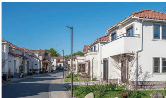
<リーフィア町田小山ヶ丘>