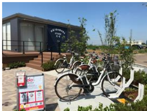
ステーションイメージ