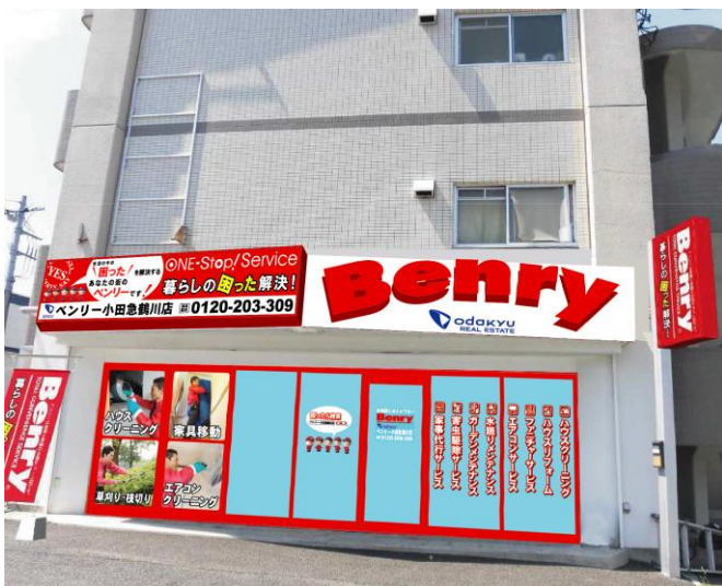
&lt;第1号店 店舗イメージ&gt;